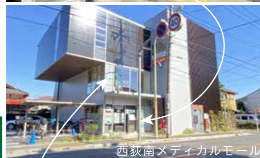
西荻南メディカルモール