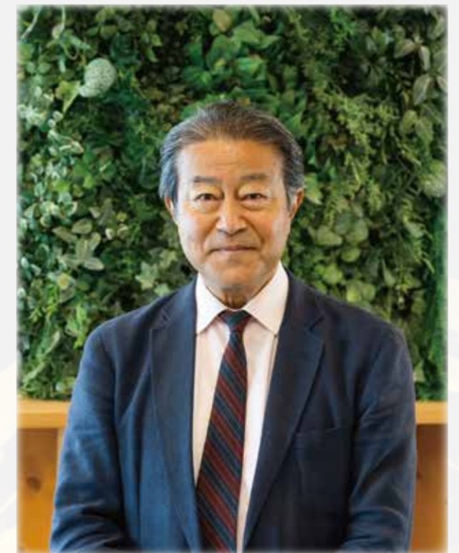
社会医療法人 河北医療財団