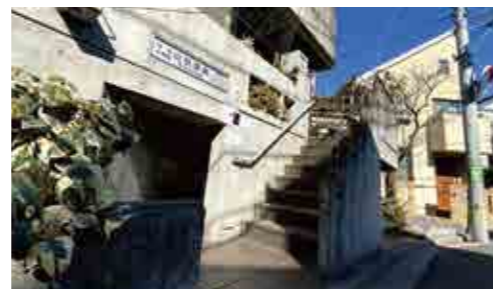
最寄り駅: 南阿佐ヶ谷 / 阿佐ヶ谷 外観

地域の誰もが気軽に相談ができ、幸せに過ごすお手伝いができるよう、これからも頑張ります。