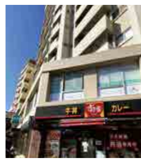
最寄り駅: 東高円寺 外観

プライベートでは子供3人の育児中です。私も実感していますが、女性のライフステージによって変わる体調の変化は個人差も大きく、また悩みも人それぞれです。小さいなことでもぜひ一度ご相談にいらしてください。