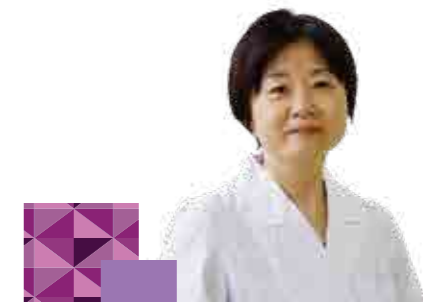
河北総合病院 眼科部長

局所麻酔で目の手術というと恐怖感が先にたって、なかなか眼科を受診できない方もいらっしゃいますが、進行してから手術はかえって時間がかかり合併症のリスクがあります。また、まわりの人が白内障だから自分もそうだろうと思っていたら違う病気だったという場合もあります。視力低下や羞明を自覚したら、眼科を受診してみることをお勧めします。