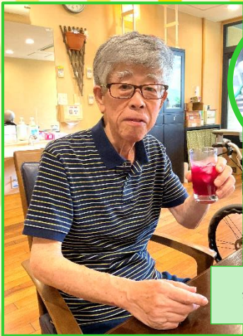
美味しくできました！