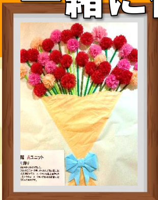
素敵な花束も作りました。