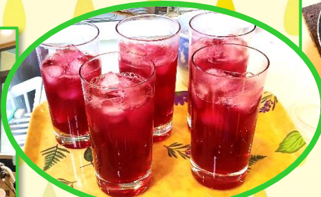
きれいな赤しそ色の ジュースが完成！