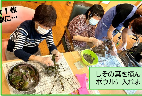
しその葉を摘んで ボウルに入れます