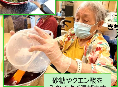
砂糖やクエン酸を 入れてよく混ぜます