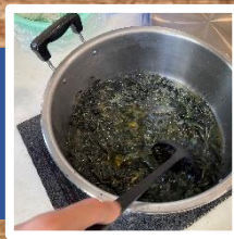
乾燥させた葉を使って 染色液を作ります