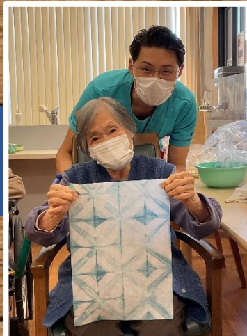
さわやかな青色に染まりました