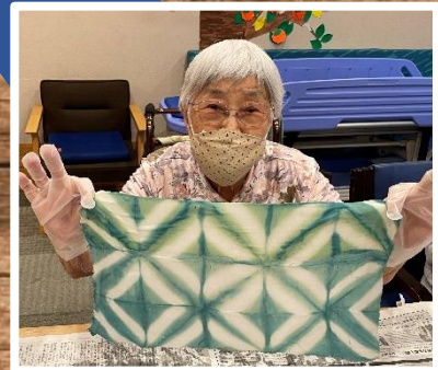
きれいに染まりましたね！