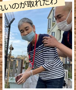
丸いのが取れたわ