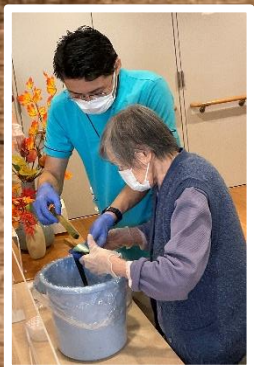
和紙を折って 割りばしに挟んで 染色液の入った バケツにドボン！