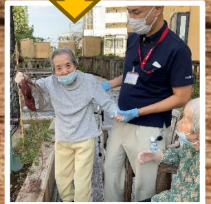
立派な紅あずまが とれて大喜び！