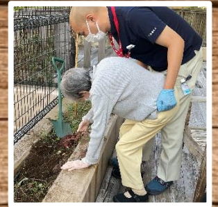
職員が支えるので安心