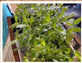
シーダ・ウォークで 育てた藍を夏に収穫