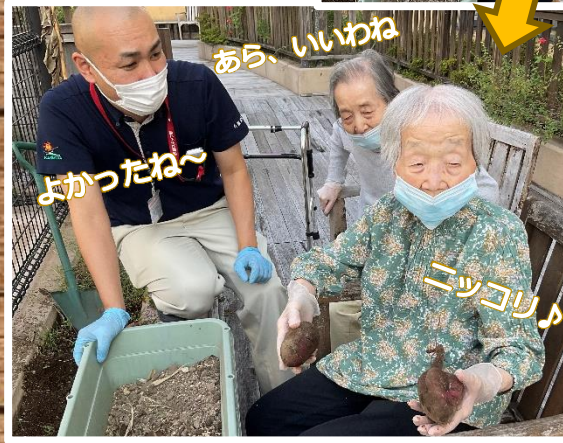
大きなさつまいもが見つかりました