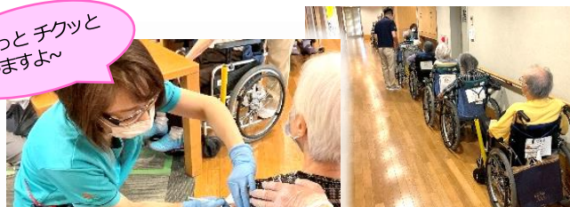
接種前は一列に並んで待機します