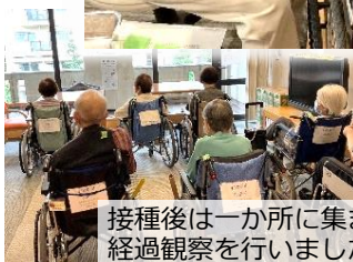
接種後は一か所に集まり、経過観察を行いました