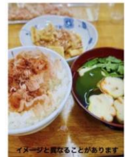
イメージと異なることがあります