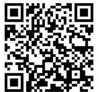
ヨガまる企画 申込QRコード