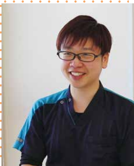
天本病院 地域包括ケア病棟 介護福祉士 看護補助職

産休育休を経て管理職として復帰しました。子育てや介護をしている職員が多いので、お互いさまの精神で助け合いながら仕事をしています。ホワイトボードに職員毎の仕事内容を書き出し見える化しているので、突然のお休みでも仕事を細分化して振り分け、各々の負担を少なくするよう工夫しています。子どもがまだ小さいので送り迎えを夫と分担したり、調理家電やデリバリーを活用するなど工夫して、大好きな仕事と家庭を両立しています。これからもみんなで協力し合いながらフォローし合える仕組みづくりと、働きやすい職場を目指していきます。