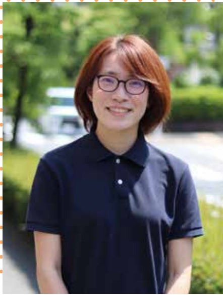
あい介護老人保健施設 介護部 部長代行 介護福祉士 東京都認知症介護実践者リーダー研修修了