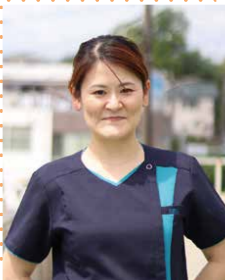
あいクリニック デイケア科 科長 介護福祉士 東京都認知症介護実践者リーダー研修修了

新卒で老健の認知症ユニットに入職しました。未経験でしたが経験を積み、資格支援制度を利用して介護福祉士と介護支援専門員の資格を取得しました。認知症の方の支援を深めるためグループホームに異動し、認知症ケアとホームの運営や管理業務を学びました。現在は老健介護部の管理職をしています。直接介護することは少なくなりましたが、職員教育や働きやすい環境づくりなどを通して利用者さんのサポートに携わっています。財団にはさまざまな事業所があり、異動や職種変更もできるので自分のやりたいことを実現できる場所がありますよ。