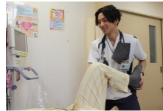
リハの時間は1単位(20分)～ 3単位(1時間)