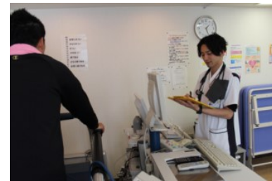
心疾患があっても安全に生活できるよう総合的にみて運動耐容能(体力)を評価します