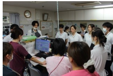
病棟にて週1回、全職種が集まり、 カンファレンスを行います