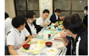
同僚とランチタイム！ 社員食堂もあります

集中治療室での超急性期から生活期まで、幅広く患者さんと関われるシステムに興味を持ちこの財団を選びました。