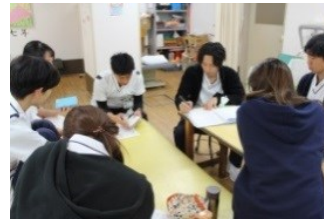
新しい患者さんの情報共有 やチームの全体の業務量調 整を行います