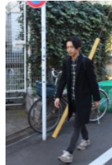
徒歩10分の 寮から出勤