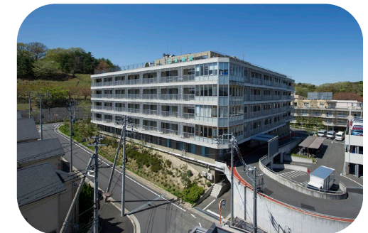
クリニック近隣に多摩南部地域病院や天本病院があり、連携医療機関として登録しています。