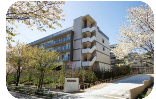
あいクリニック中沢は高齢者福祉関連施設「ゆいま〜る中沢」の1Fにあります