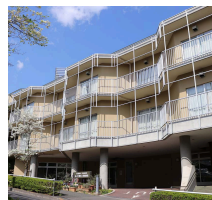
あい介護老人保健施設 (デイケア・入所)