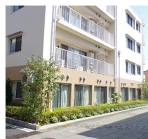
あい小規模多機能施設 かりん

集合場所：あい小規模多機能施設こもれび (多摩市永山3-12-1西永山福祉施設 ※車可)