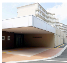
あい小規模多機能施設 こもれび