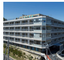
天本病院 (デイケア・病棟)