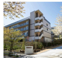
あいグループホーム 天の川/あい看護小規模 多機能施設ほたる