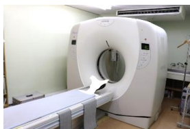
脳や頭部、胸部や腹部の疾患など全身の診断が可能なマルチスライスCTスキャナを設置