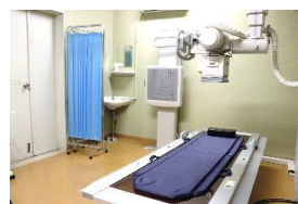
レントゲン、エコー、胃カメラなど各種検査が可能です