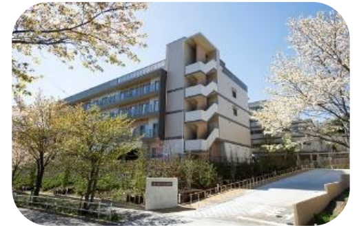
あいクリニック中沢は高齢者福祉関連施設「ゆいま〜る中沢」の1Fにあります