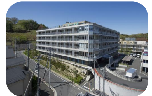
クリニック近隣に多摩南部地域病院や天本病院があり、連携医療機関として登録しています。