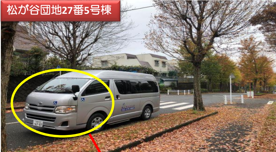
松が谷団地27番5号棟