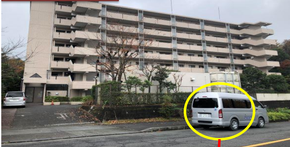
パークサイド松が谷