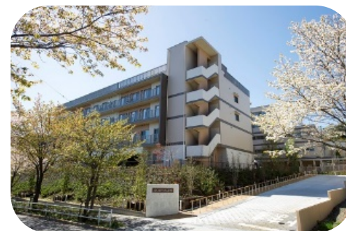
あいクリニック中沢は高齢者福祉関連施設「ゆいま〜る中沢」の1Fにあります