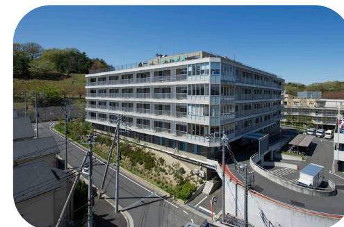
クリニック近隣に多摩南部地域病院や天本病院があり、連携医療機関として登録しています。