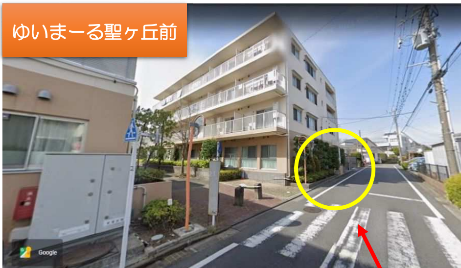
ゆいまーる聖ヶ丘前