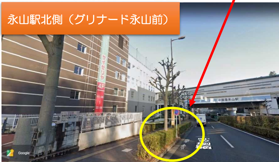
永山駅北側（グリナード永山前）