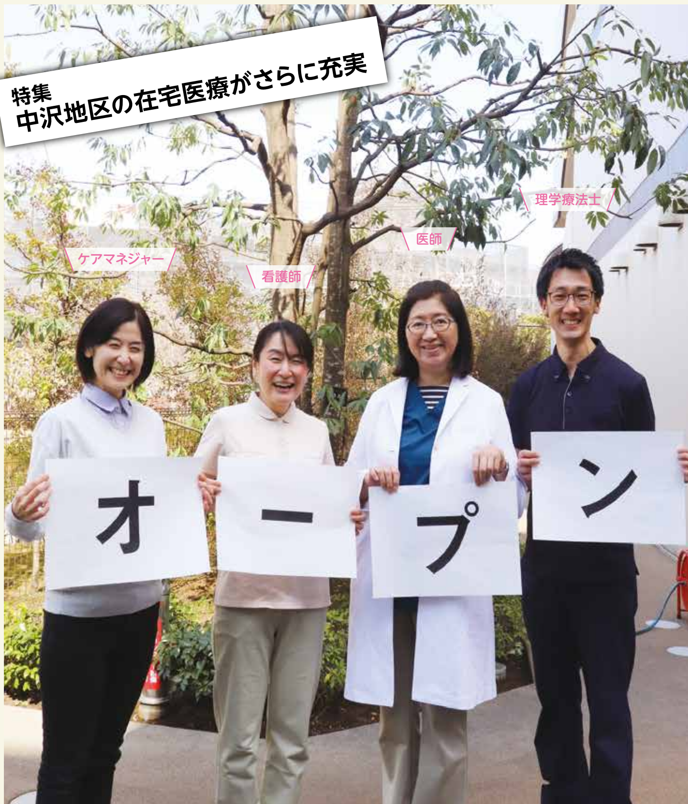
ケアプランセンターあいクリニック中沢・あい訪問看護ステーション中沢・あいクリニック中沢のスタッフたち