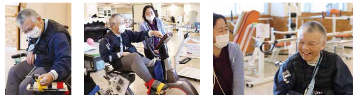
力の入らない右足を安定させるため、自作の補助具を取り付けトレーニング。 「退院してから10kg太っちゃったからね(笑)。改良を重ねて使いやすくなってきたかな」